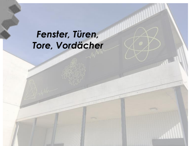
Fenster, Türen, Tore, Vordächer